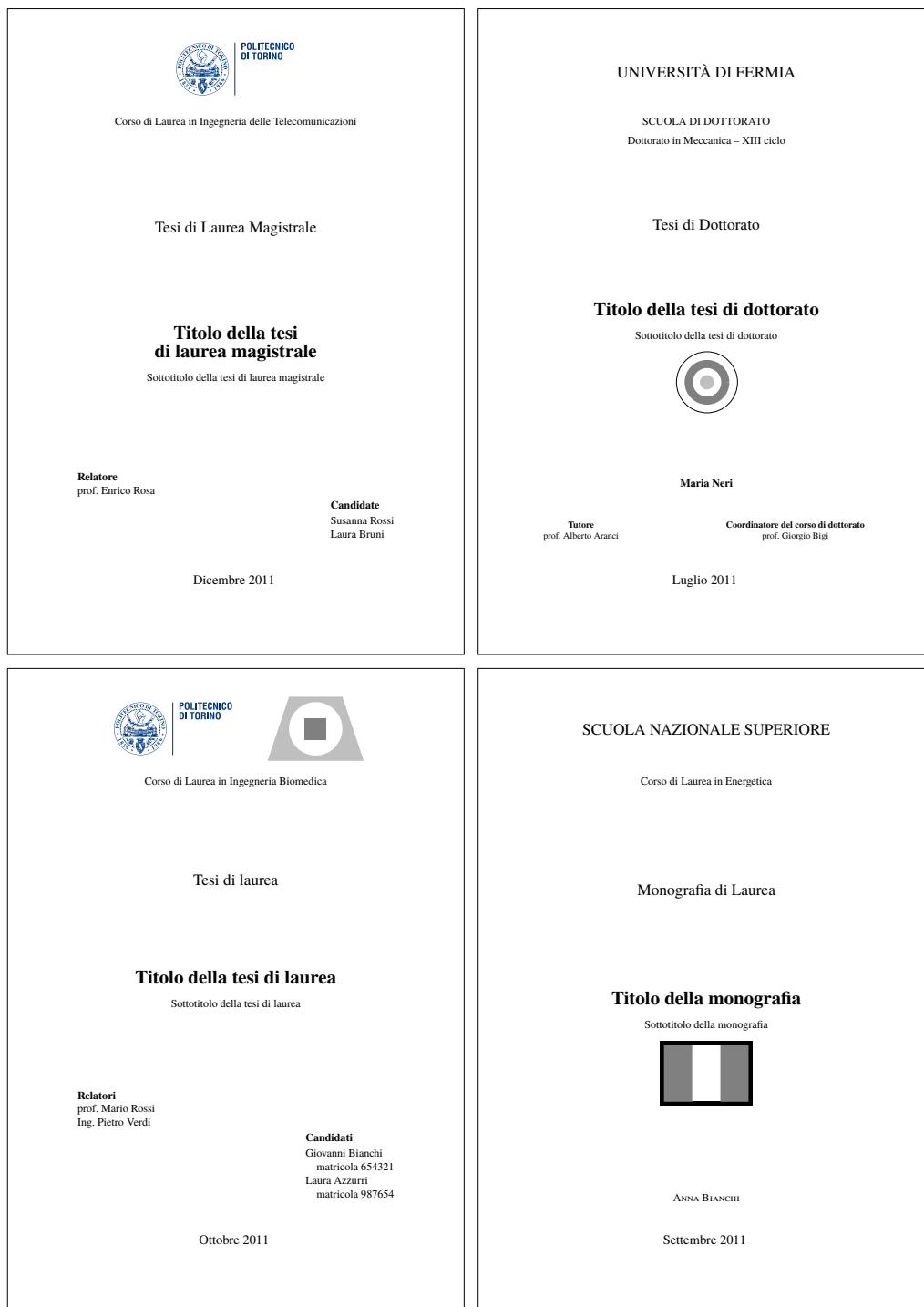
Figura 4.1. I quattro frontespizi fondamentali